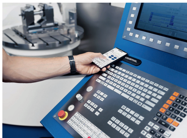
2 Die Inbetriebnahme und Bedienung sind einfach und intuitiv

& Play-Lösung und eine cloudbasierte Plattform mit intelligenter, automatisierter und zuverlässiger Messung zu einer Innovation, die Industrie 4.0 bei metallverarbeitenden Unternehmen weiter voran bringt. Der zusätzlich erhältlich Liquidtool-Sensor macht die Datenerhebung denkbar einfach. So ist die Inbetriebnahme des Sensors so einfach und intuitiv wie möglich: Der hoch