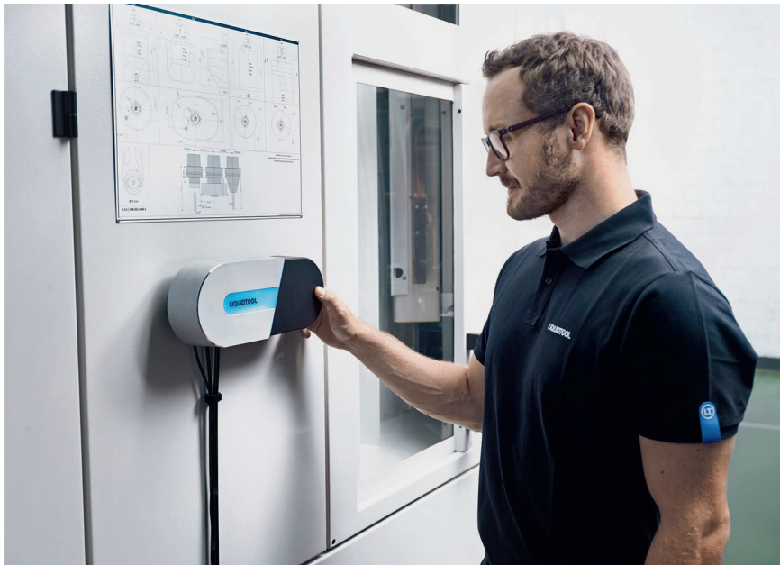
1 Der Liquidtool Coolant Manager ist eine intelligente, IIoT-basierte Lösung zur KSS-Überwachung

Eine IIoT-basierte Lösung zur Überwachung von Kühlschmierstoffen bringt Zuverlässigkeit ins KSS-Management. Unter- oder Überdosierungen sind in Zukunft passé.